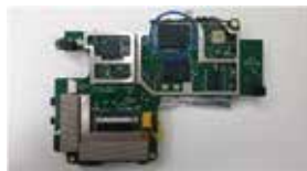
削除データからも走行軌跡を解析可能です

複数のツールを用いて専門の技術者が解析を行い、捜査報告書には記載されていなかった被告人の主張を裏付けるデータを復元・抽出。