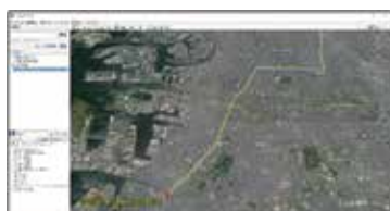
Google Earth で表示できる KML ファイルを提出

削除された LINE、Twitter、Skype のメッセージ復元。スマホの操作ログ、発信履歴、写真の Exif 情報の解析。カーナビ走行軌跡の調査。犯行時の状況を立証するためゲームアプリの操作履歴を調査。